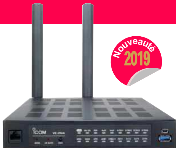
Format 1U rack 19" intégrable dans une mini baie