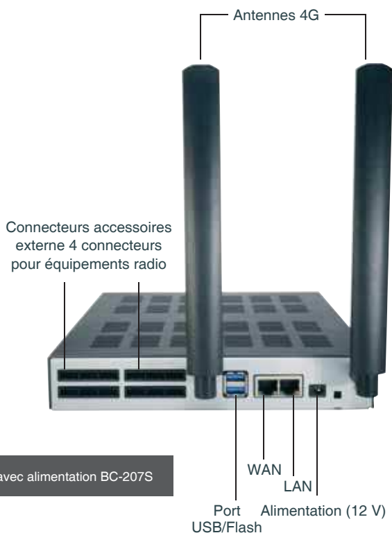
Livrée avec alimentation BC-207S